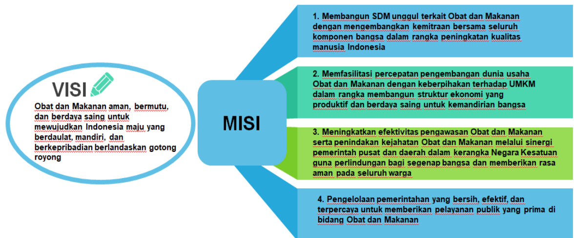
Gambar 1. Visi dan Misi Badan POM

Badan Pengawas Obat dan Makanan Republik Indonesia (BPOM RI) merupakan Lembaga Non Kementrian yang bertanggung jawab dalam mengawasi peredaran makanan, minuman dan obat-obatan yang beredar di Indonesia. Dalam pelaksanaannya, Badan POM mempunyai visi dan misi untuk mendukung upaya pemerintah dalam meningkatkan kesehatan masyarakat, seperti yang disebutkan di bawah ini: