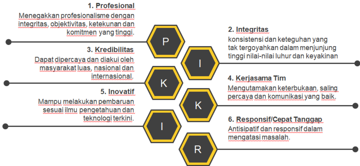
Gambar 2. Budaya Organisasi Badan POM